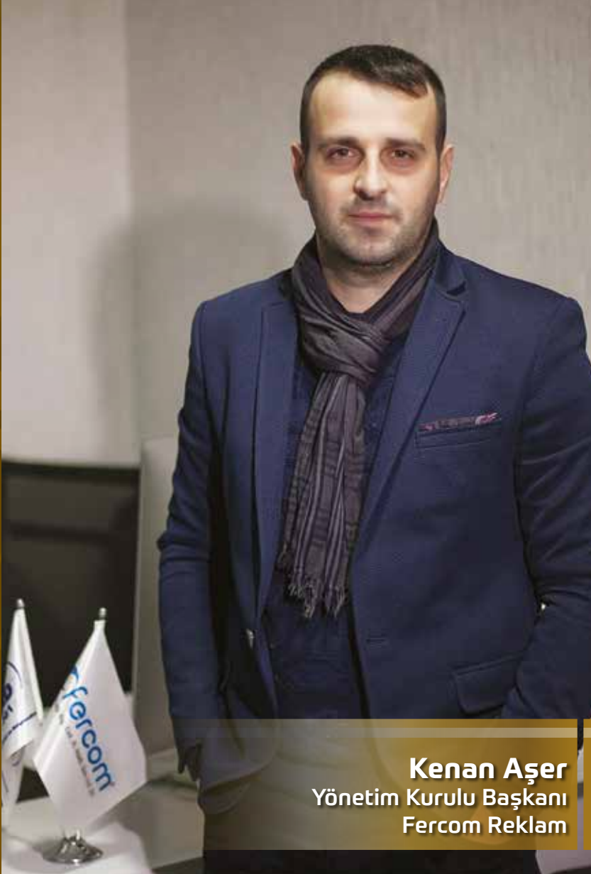
Kenan Aşer Yönetim Kurulu Başkanı Fercom Reklam