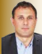
BÜLENT BİLECCEN Meclis Üyesi