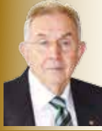
TAHA ÜLKER Meclis Başkanı

SCHNEE METAL PLASTİK SAN. VE TİC. LTD. ŞTİ.